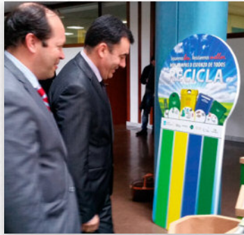
O Conselleiro de Cultura durante a súa visita ao stand da iniciativa

Ademais de capacitalos para aplicar de forma correcta o principio dos tres erres, os rapaces poderán transmitir os seus coñecementos ao seu círculo de familiares e amigos.