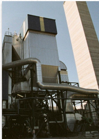
Planta Termoeléctrica onde se procede á valorización enerxética do combustible derivado dos residuos non reciclables (CDR)

Neste sentido, é preciso recordar que, a nivel industrial, as plantas de valorización enerxética europeas son as máis vixiadas nos seus aspectos medioambientais, o