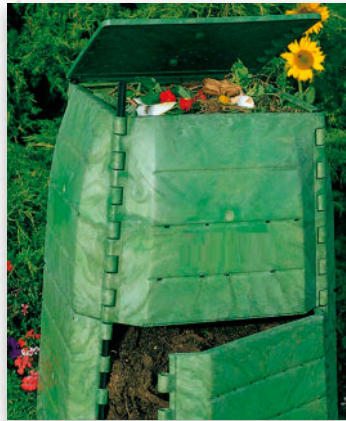
Composteiro distribuído por Sogama

En Cerdedo, o goberno local procederá á selección das vivendas participantes, que contarán cun composteiro para a fabricación do seu propio abono natural a partir da materia orgánica xerada nas súas casas. O compost resultante poderá utilizarse como fertilizante natural en hortas, xardíns e terras de cultivos. Como parte do proceso, os veciños adscritos recibirán a correspondente formación inicial, encargándose o concello de visitar casa por casa para comprobar a técnica aplicada, solventar posibles dúbidas e co-rrixir erros.