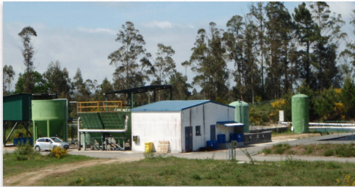
EDAR do complexo industrial de Sogama

O importe dos traballos, que deberán executarse nun período máximo de 6 meses, supera o medio millón de euros.