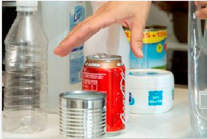
Envases tipo que se depositan no contenedor amarelo