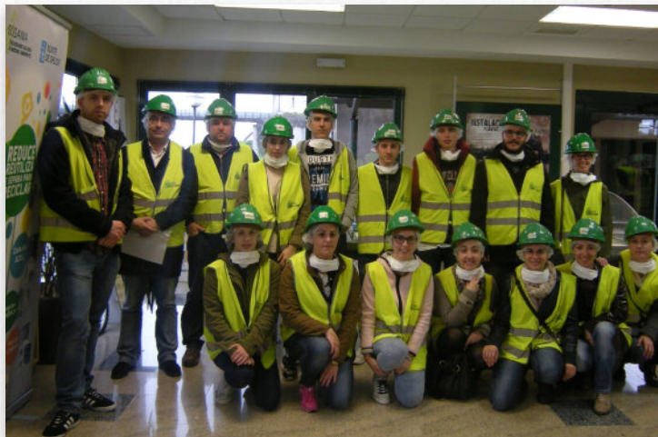
Todas as fotos das visitas poden verse en www.sogama.es

Tras finalizar o percorrido, os visitantes valoraron de forma moi positiva o labor desenvolvido pola empresa pública, que concentra a xestión e o tratamento dos residuos urbanos producidos na maior parte do territorio galego.