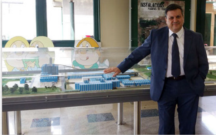
Una maqueta del complejo industrial se Sogama se encuentra situada en el área de recepción del edificio de oficinas de la entidad

Mientras que en los países del norte de Europa las plantas de valorización energética están plenamente aceptadas desde el punto de vista social, ubicándose incluso en el propio corazón de las ciudades, en España se detecta cierta desconfianza hacia las mismas. ¿A qué son debidas estas distintas percepciones? A la falta de conocimiento, sin duda. Estamos hablando de un tipo de tecnología que está considerada como una de las más benignas desde la dimensión ambiental y que, además de eliminar el residuo, lo transforma en energía. Esto quiere decir que desde Sogama estamos eliminando un problema y creando una solución.