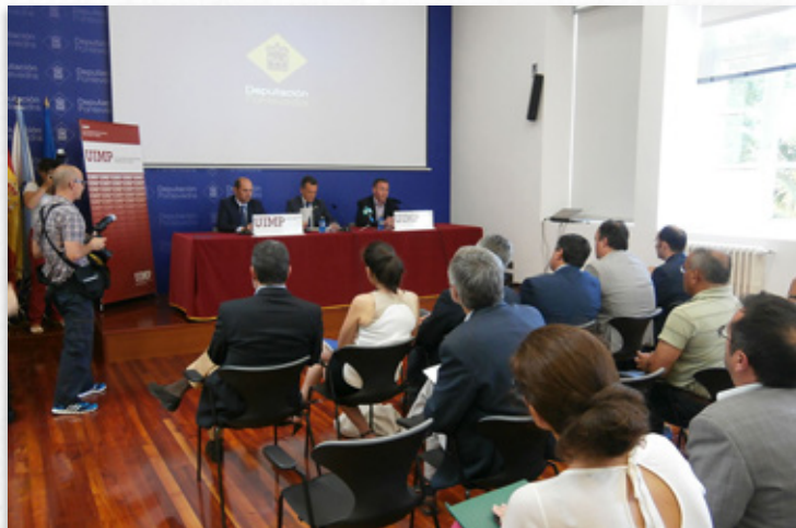
O curso tivo lugar a comezos de xullo en Pontevedra