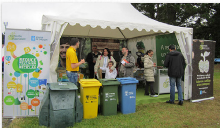
Carpa de Sogama na festa de Voz Natura

Como manda a tradición, o parque de Acea de Ama en Culleredo (A Coruña) acolleu a festa de clausura da 16ª edición de Voz Natura. Máis de 50.000 escolares de toda Galicia participaron na actividade que este ano académico se dedicou de cheo ás enerxías renovables pola súa contribución á protección e mellora do medio ambiente.