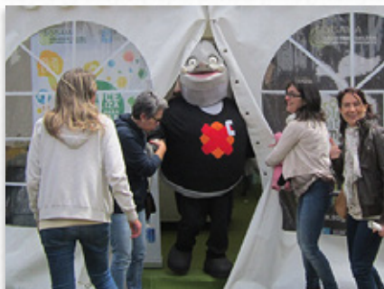
A mascota do Xabarín Club tamén acudiu á festa de Voz Natura