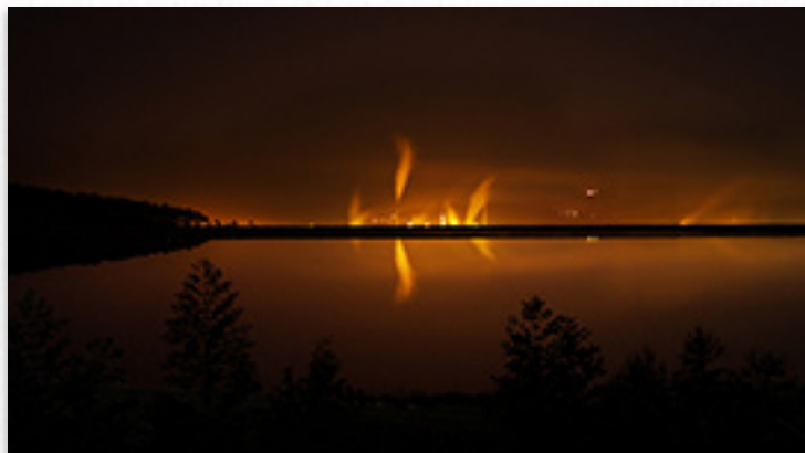
1º premio, categoría adultos e Top Cervo