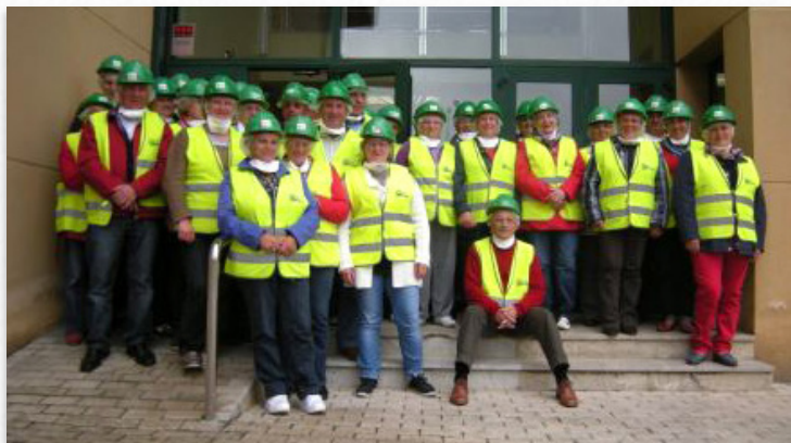
Un grupo de veciños de Xove