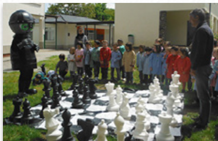
Xaquedrím xogou ao xadrez na súa presentación en sociedade