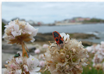
1º premio da categoría xuvenil

O concello lucense de Cervo entregou no Día Mundial do Medio Ambiente (5 de xuño) os premios do III Concurso de Fotografía Medioambiental "Cervo Respecta 2013", que contou coa colaboración de Sogama. Esta é unha iniciativa xestada para poñer en valor o patrimonio natural de Galicia e contribuír á concienciación da poboación sobre a necesidade de participar na súa protección como garantía de saúde, benestar e calidade de vida.