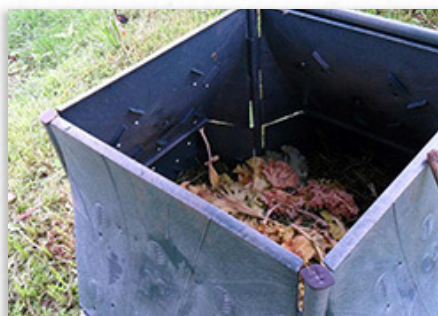
O composteiro favorece a fermentación

O compost resultante, tal e como xa se comprobou noutras experiencias, será un abono natural con gran poder fertilizante para hortas, xardíns e terras de cultivo.