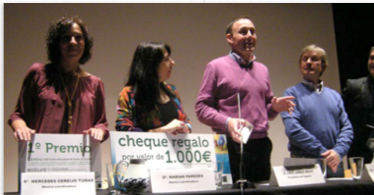
Acto de entrega do premio en Outes

Co seu proxecto "Pensando en R", o CEIP Emilio Navasqués de Outes (A Coruña) proclamouse gañador do concurso de innovación educativa "Recíclate con Sogama 2012-2013". O CRA de Monterrei e o CEIP Manuel Masdías de Ferrol fixéronse co segundo e terceiro posto respectivamente.