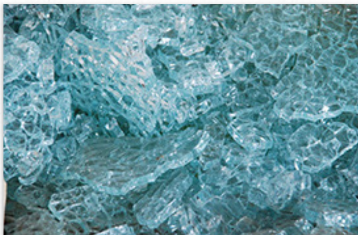
O vidro é reciclable 100%

A Sociedade Galega do Medio Ambiente ingresará arredor de 1.460.000 euros pola venda de vidro, aluminio e aceiro residual contidos no lixo en masa recepcionado no complexo medioambiental de Cerceda tras a adxudicación dos respectivos contratos.