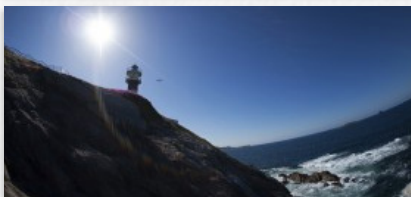
2º e 3º premio, categoría adultos e Top Cervo