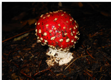
2º premio da categoría xuvenil