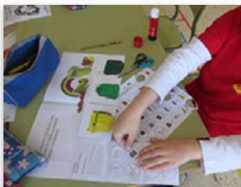
Material didáctico elaborado polos alumnos de Outes

O CRA de Monterrei e o CEIP Manuel Masdías de Ferrol foron, respectivamente, o segundo e terceiro galardoados. Ademais, e co obxectivo de recoñecer o labor daqueles centros que destacaron polo seu esforzo e traballo, concedéronse accésitos ao CEIP Coirón Dena de Meaño, CEIP de Oca, en A Estrada, e CPI Ramón Piñeiro de Láncara (Lugo).