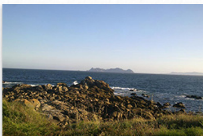
A efeméride conmemórase o 8 de xuño

Segundo datos da Axencia Ambiental Federal de Alemaña, calcúlase que o volume de lixo nos océanos do mundo supera os cen millóns de toneladas, das cales o 80 por cento procede de residuos xerados no ámbito terrestre. O exemplo máis visible da contaminación oceánica é a denominada