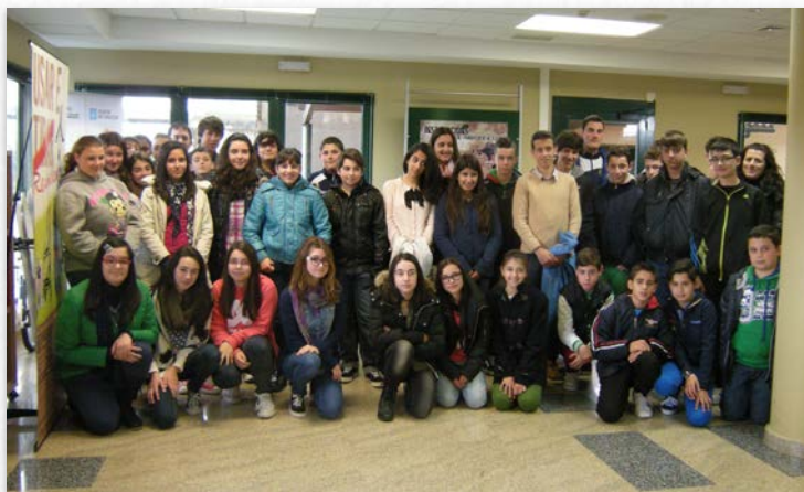
Alumnos do colexio Sagrada Familia – Aldán de Cangas de Morrazo (Pontevedra)