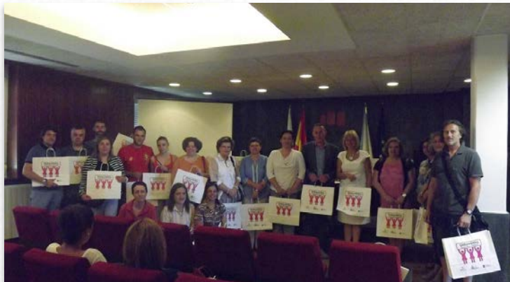
As bolsas están feitas con papel reciclado e biodegradable