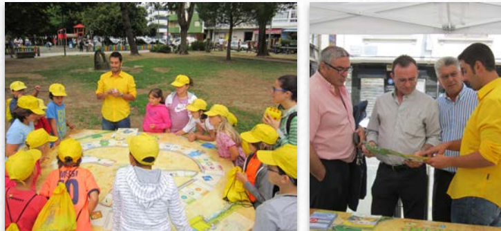
Nenos e maiores recibiron as explicacións dos educadores ambientais

Os monitores da campaña "Separemos ben, reciclaremos mellor" despráronse polas catro provincias nunha aula móbil