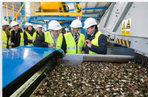
A inauguración da infraestrutura tivo lugar o pasado 27 de xaneiro