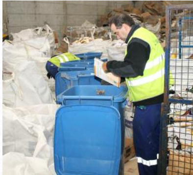
Traballador de Coregal manexando maquinaria

É certo que o principio medioambiental evolucionou considerablemente nas políticas dos países comunitarios, desenvolvéndose procesos que xestionan a contaminación a nivel industrial. Non obstante, o principio de igualdade non se instalou nos mercados de maneira paralela ao anterior. Aínda hoxe en día, o colectivo de persoas con discapacidade sofre tanto pola súa condición como pola enorme crise económica, que son as grandes limitacións no proceso de incorporación ao mercado laboral. Nós traballamos coa vontade de formar profesionais competentes que poidan desenvolver o seu labor tanto na empresa ordinaria como nas nosas, xerando postos de traballo dignos e estables.