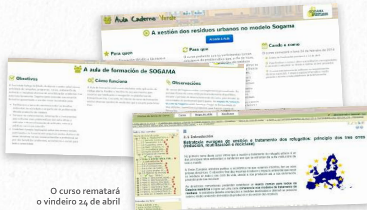
O curso rematará o vindeiro 24 de abril

A Consellería de Medio Ambiente e Sogama puxeron en marcha un curso de formación on line con 30 horas lectivas. O éxito da convocatoria obrigou a ampliar a máis de 80 as prazas dispoñibles, limitadas inicialmente a 50.