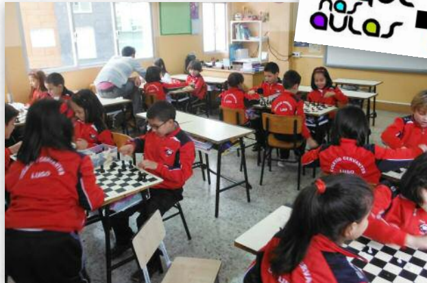
As clases desenvólvense en horario lectivo e nas propias aulas