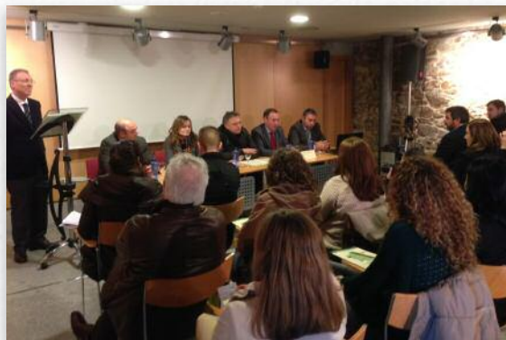
A 53 edición dos Cursos de Saúde Ambiental tivo lugar entre o 17 e 20 de febreiro do ano en curso

As xornadas, que tiveron lugar na terceira semana de febreiro, estruturáronse en catro mesas redondas centradas en temáticas de actualidade tales como a xestión dos residuos, dos recursos e da auga, o cambio climático e o turismo sostible.