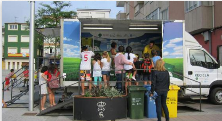
A campaña divulgativa permanecerá en vigor ata xuño