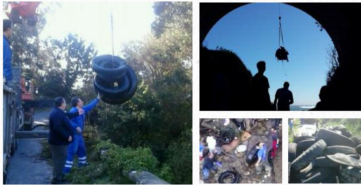
Recollida de lixo na praia dos Alemáns de Foz (Lugo)