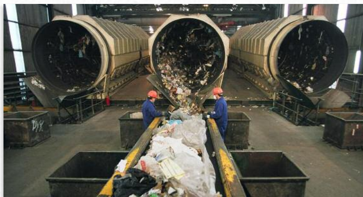
O novo plan de acción foi clave para aumentar a rendibilidade do complexo industrial de Cerceda

Nos últimos cinco anos, a Sociedade Galega do Medio Ambiente conseguiu diminuír, nun 48,81 por cento, as cantidades desviadas ao vertedoiro de residuos non perigosos de Areosa. Isto foi posible grazas á maior eficiencia e produtividade do complexo medioambiental, incrementada no mesmo período nun 19,33 por cento.