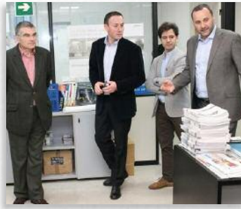
O presidente de Sogama (centro) durante a visita a Cogami